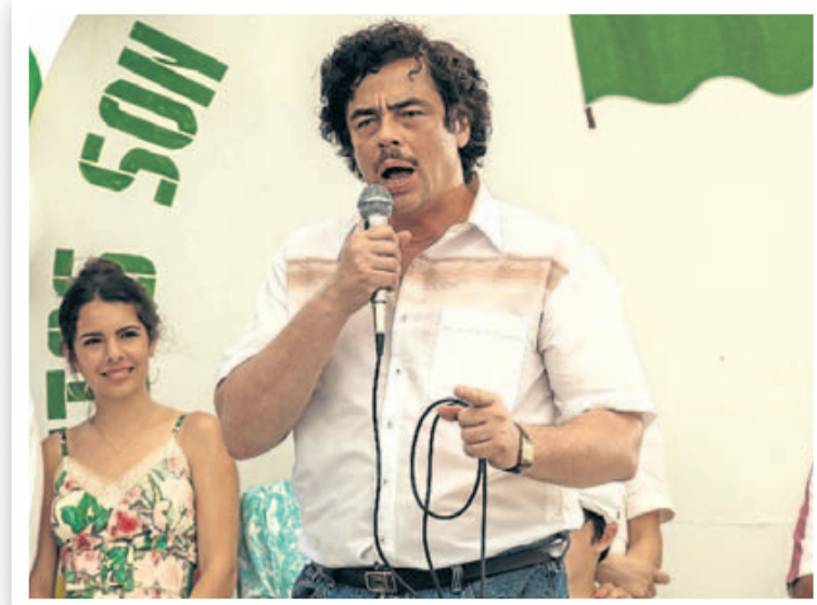
Benicio del Toro, caracterizado de Pablo Escobar en el filme.