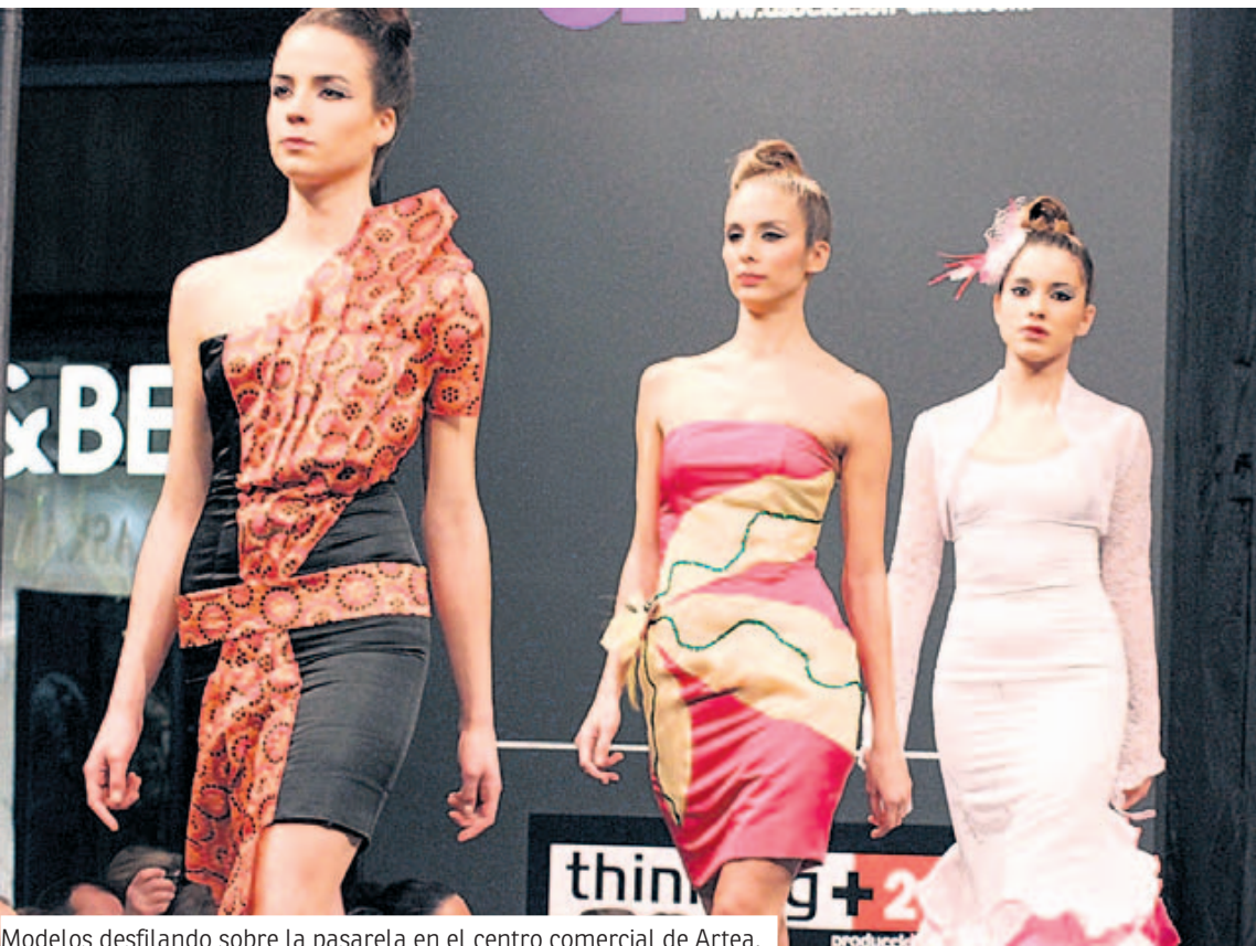
Modelos desfilando sobre la pasarela en el centro comercial de Artea.